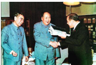
日本首相的16次访华足迹