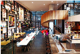
精简豪华酒店：三星级价格五星级享受