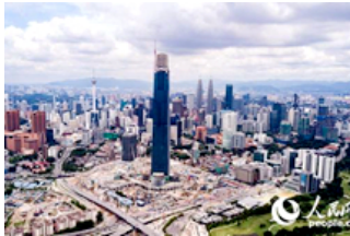
航拍中企承建海外最高建筑