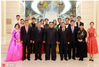
金正恩观看中朝文艺工作者联合演出