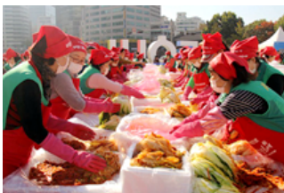
首尔举办“越冬泡菜文化节”